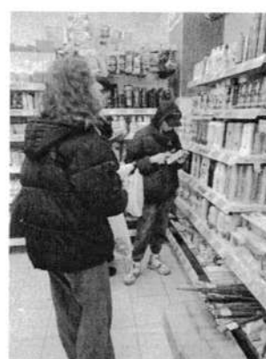
МОЙ ВЫБОР - продолжение