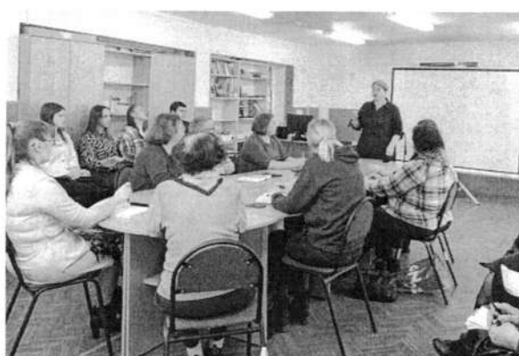
МОЙ ВЫБОР - продолжение