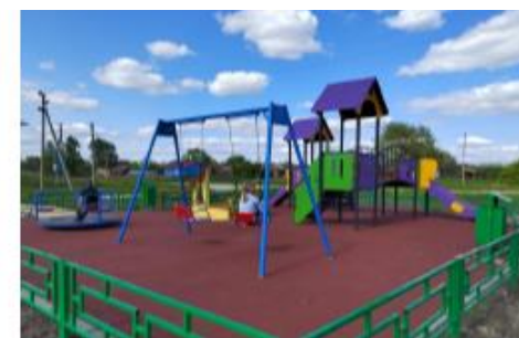
Детская игровая площадка в с. Журавинки,