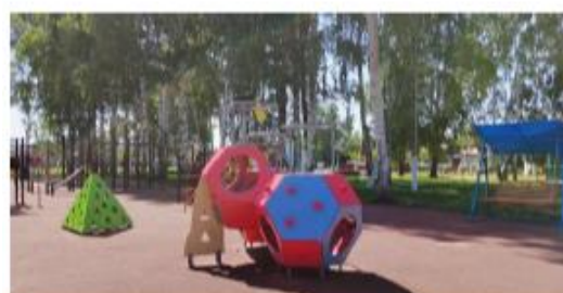
Обустройство сквера в с. Пиково