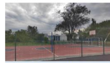
Универсальная спортивная площадка в с. Пиково

Строительство индивидуальных жилых домов для предоставления в аренду работникам предприятия, что позволит обеспечить новым жильем работников и их семей, сохранить постоянные рабочие места и увеличить площадь нового строительства на территории села. Внесены изменения в муниципальную программу «Комплексное развитие сельских территорий сельского поселения Пиковский сельсовет Чаплыгинского муниципального района Липецкой области на 2021-2026 годы», включено мероприятие по реализации проекта «Предоставление жилья в найм» с необходимым финансированием на плановый период согласно сметному расчету.