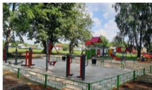
Детская спортивно-игровая площадка в с. Пиково

В рамках синхронизации реализованы проекты по благоустройству