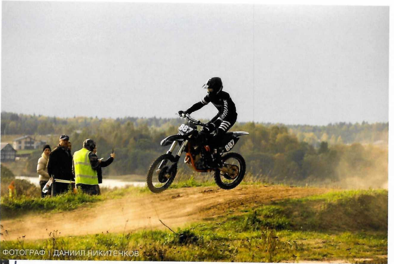
ФОТОГРАФ | ДАНИИЛ НИКИТЕНКОВ