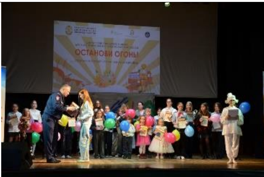
Проведены теоретические и практические занятия с ДЮП;