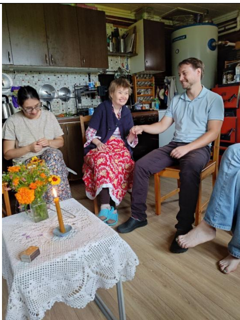
Утренний «круг» в Социальной деревне «Чистые ключи»