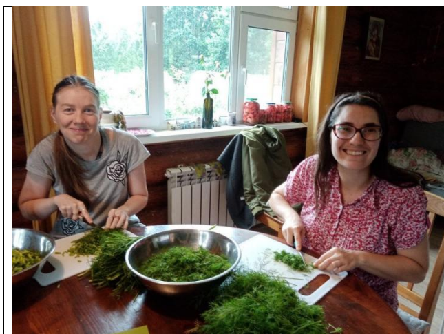
Участники проекта занимаются заготовкой зелени на зиму