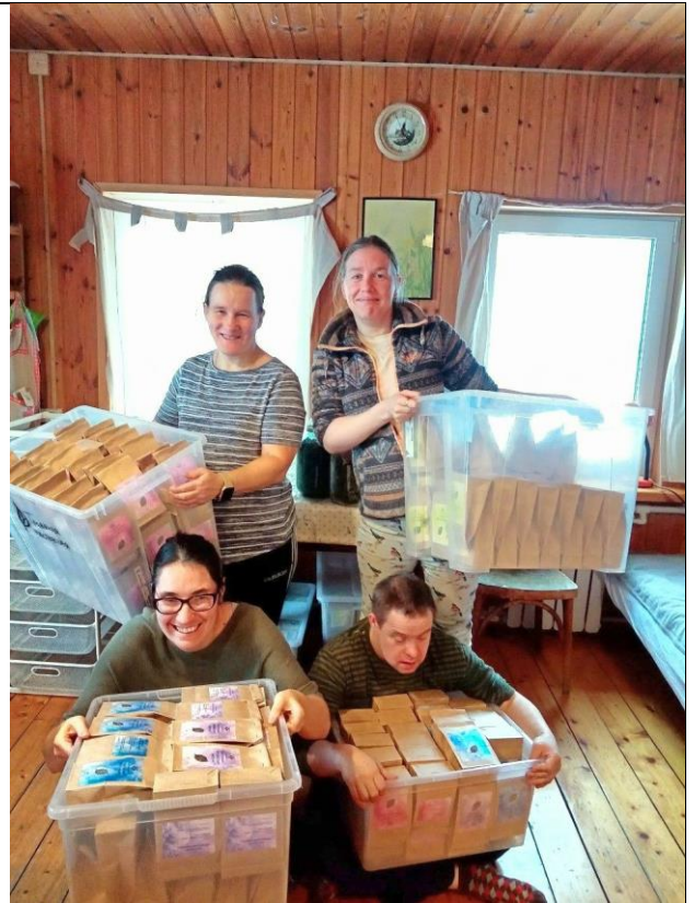
Участники проекта показывают результат своей работы в травяной мастерской.