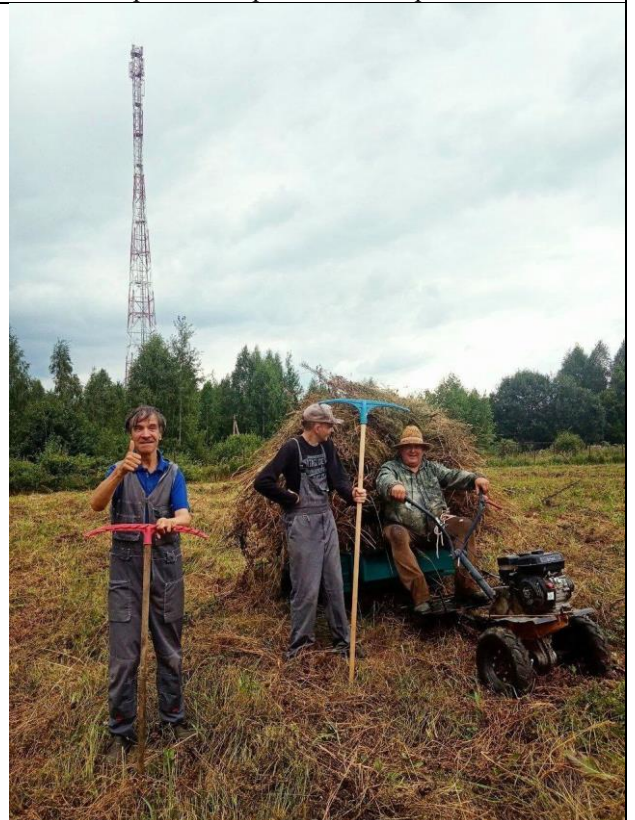
Участники проекта убирают сено на территории социальной деревни.