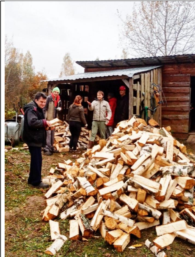
Участники проекта готовятся к зиме: укладывают дрова в поленицу.