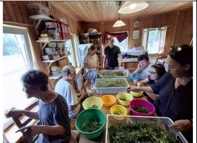
Участники проекта трудятся в мастерской