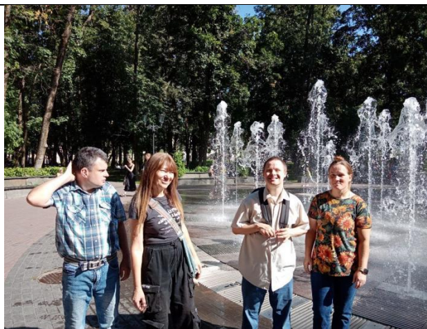
Участники проекта на прогулке в городе