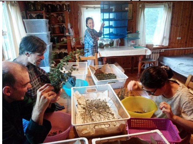
Участники проекта трудятся в мастерской