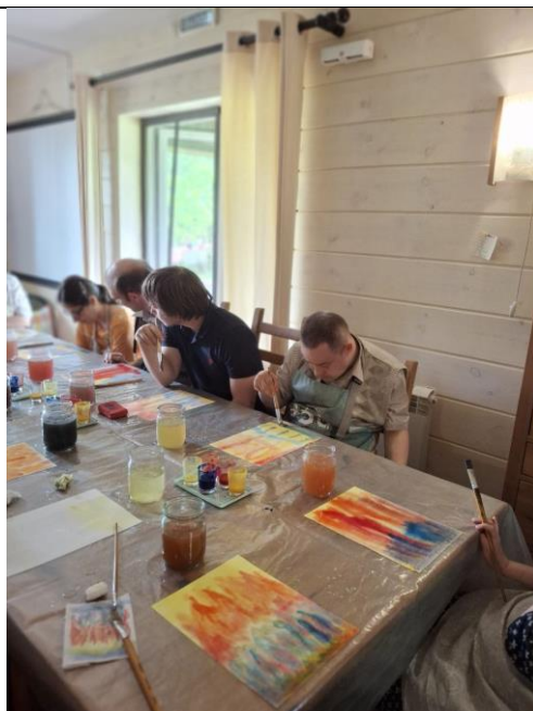
Рисование в Социальной деревне «Чистые ключи»