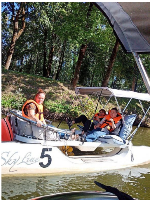
Участники проекта на прогулке в городе