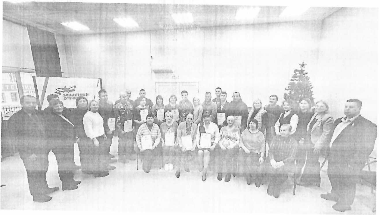
15.12.2025 – День Геров в финале Государственного фонда поддержки участников специальной военной операции «Защитники Отечества» по Смоленской области