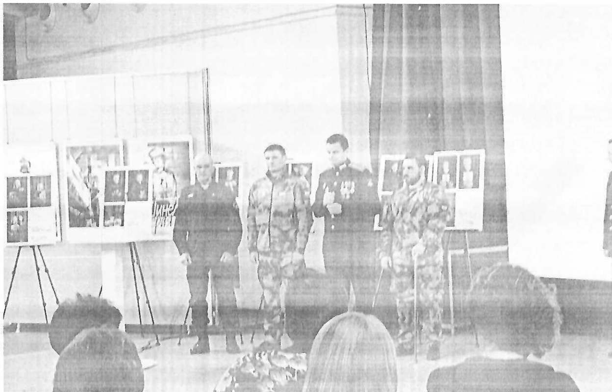
05.12.2025 – участие в открытии фотовыставки «Мамино Сердце», обсуждение вопросов увековечения памяти погибших участников СВО.