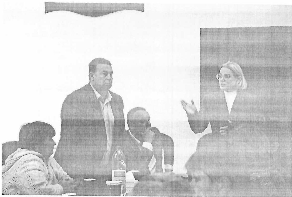
19.09.2025 – обсуждение с членами семей участников специальной военной операции в Сычевском МО.

29.08.2025 – встреча социальных координаторов филиала фонда «Защитники Отечества», сотрудников ЛНО «Ради будущего», представителей Смоленской епархии в храме-музее Спаса-Преображенской церкви.