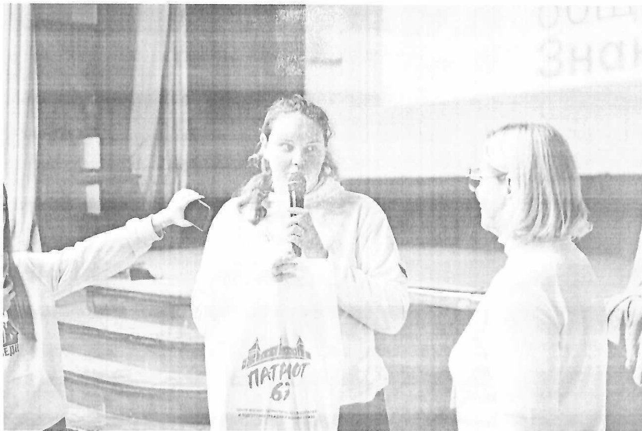
19.11.2025 - Встреча с участниками историко-патриотической смены «Волонтеры Победы»