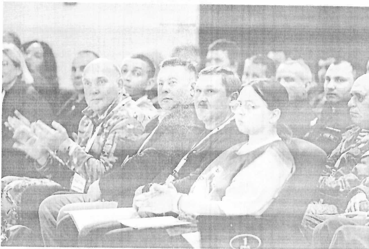
10.10.2025 – участие в установочной конференции.