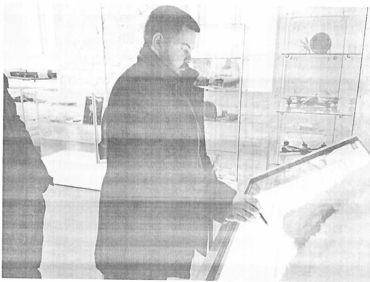
Интерактивная панель, размещенная в храме-музее Спасо-Преображенской церкви.

Представлены фотография приобретенного оборудования в рамках проекта и размещенного в храме-памятнике Защитникам Отечества (Спасо-Преображенская церковь, г. Смоленск, ул. Реввоенсовета, 13).