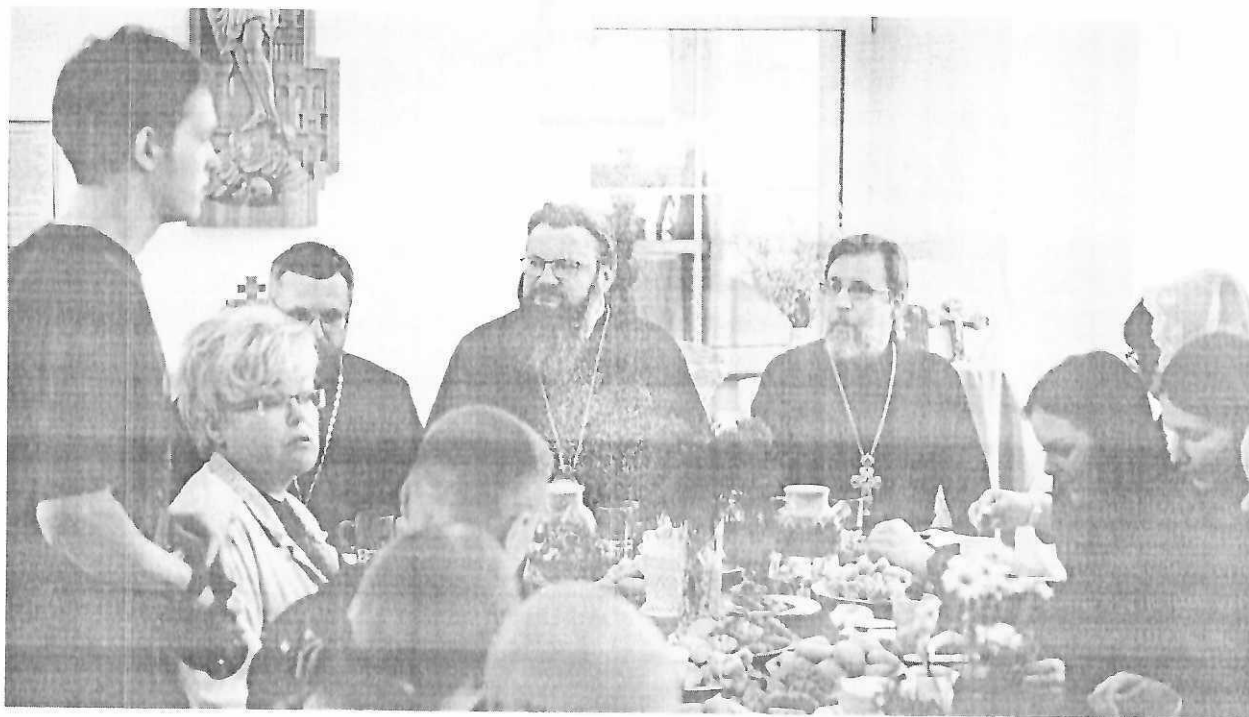
19.07.2025 – встреча со студентами в храме-музее Спаса-Преображения.

29.08.2025 – встреча социальных координаторов филиала фонда «Защитники Отечества», сотрудников ЛНО «Ради будущего», представителей Смоленской епархии в храме-музее Спаса-Преображенской церкви.