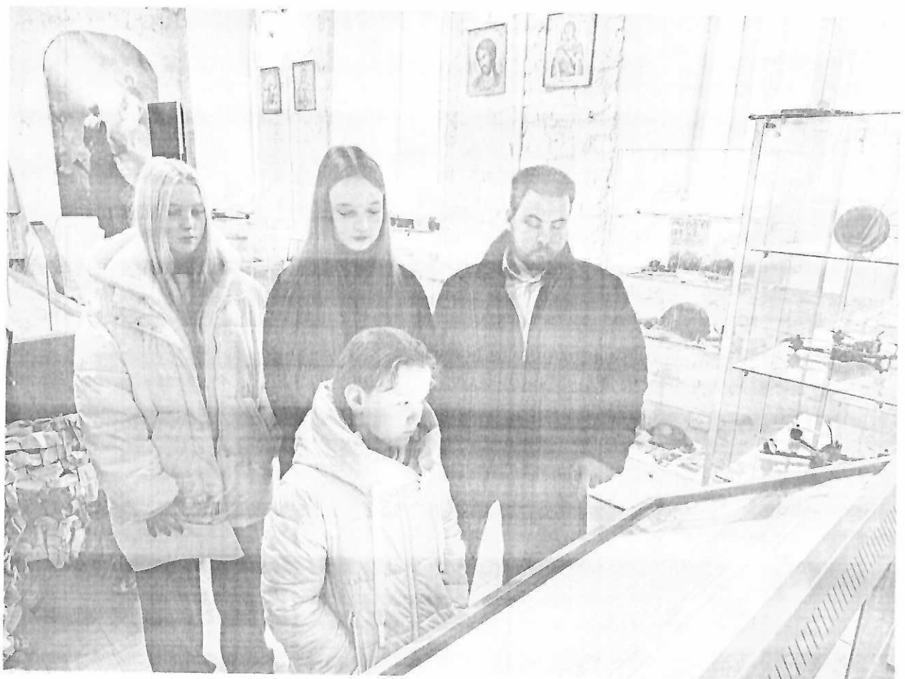
20.12.2025 – посещение участниками общественного движения «Волонтеры Победы» храма-музея в Спасо-Преображенской церкви. Демонстрация выполненной работы.